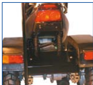
Forstærkningssæt består af en ekstra fjeder. Forstærkningssættet anbefales til brugere over 90 kg