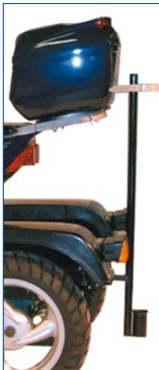
Stokkeholdere tilbydes til henholdvis een eller to stokke