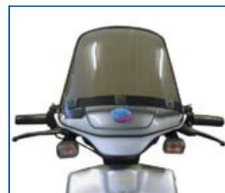
Vindspejl - her illustreret en lille model.