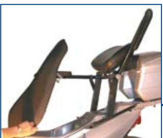
Rygstøtten vises opklappet for at skabe adgang til opbevaringsboksen under sædet