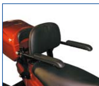
Rygstøtte med armlæn. Giver brugeren god støtte og behagelig siddekomfort