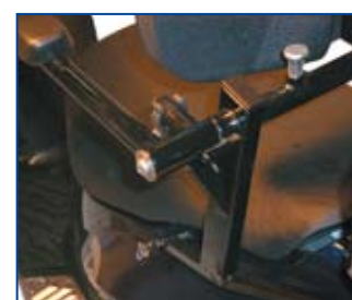
Rygstøtten tilbydes med ekstra bredde mellem armlænene