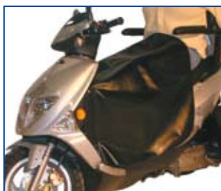
Kuskeslag beskytter mod vind og regn, og er meget anvendeligt i dagligdagen