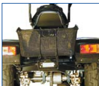
Kurv monteret mellem bag-skærme