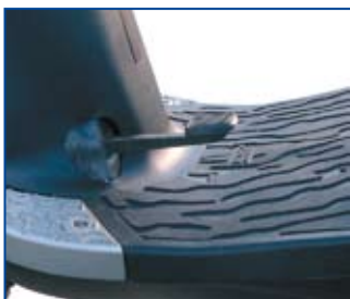
Fodbremse kan monteres til behov hvor den ene af de to håndbetjente bremses ikke lader sig anvende