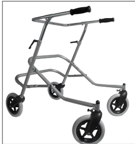
Medico Terapi Rollator Str. 3