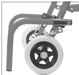
Slæbebremse, antitip (tilbehør)