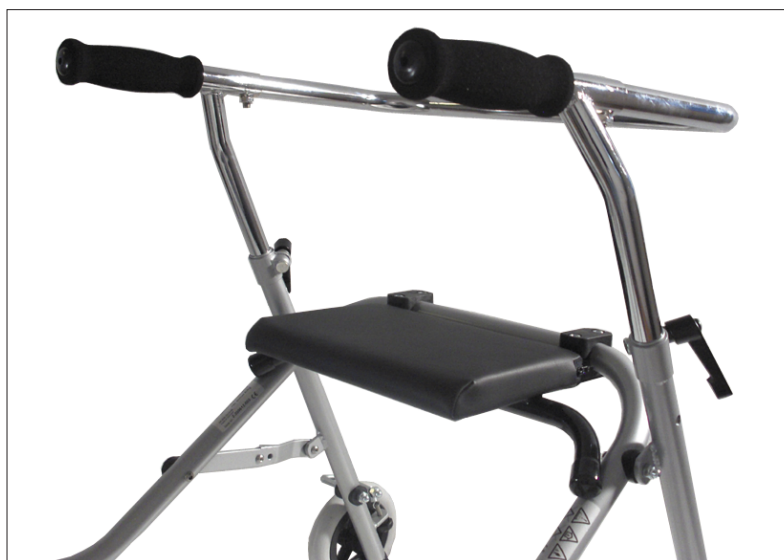
Opklappeligt sæde (tilbehør)